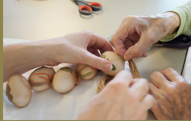
Besuch in der Scheidegg 2022